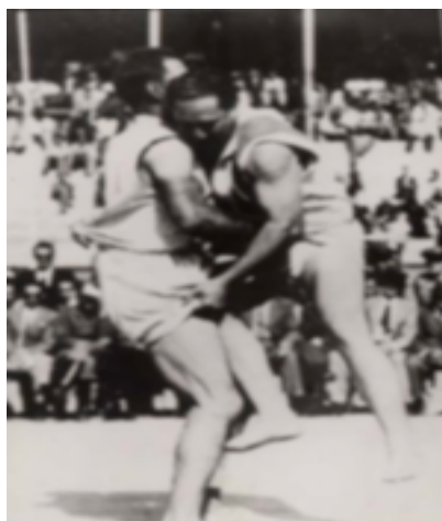
9. Levantada en plaza de toros

innovaciones que irán imponiendo los diferentes organismos que se encargarán de regir y normalizar, en los parámetros legales de la dictadura del general Franco, el deporte autóctono.