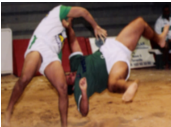
14. lucha canaria masculina más de 105 kg