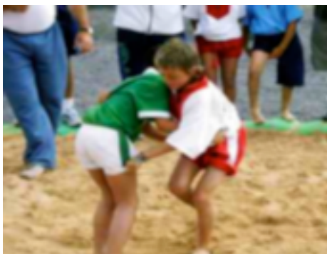
15. Lucha canaria de equipos juveniles

Campeonatos de Canarias de Equipos Juveniles: cada edición