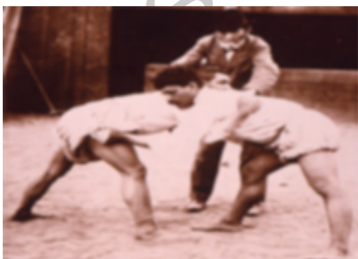
6. Luchada en el antiguo circo Cuyás

Por el año 1943 se constituye la Federación de Lucha Canaria naciendo así la etapa institucional, citada anteriormente, de este deporte. Aparece la reglamentación, los equipos federados, colegios de árbitros y entrenadores, e insular. Todo esto convierte a la