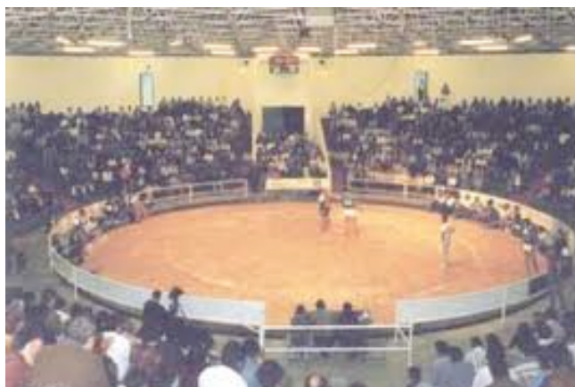
8. Luchada actual

En 1985 se celebró la primera asamblea general para la resolución de un recurso sobre las elecciones de la Junta de Gobierno, la Asamblea se denominaba por entonces Consejería de Cultura y Deportes.