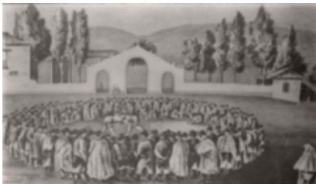
11. Luchada en la plaza del Cristo

En la actualidad, la lucha canaria está organizada por la Federación