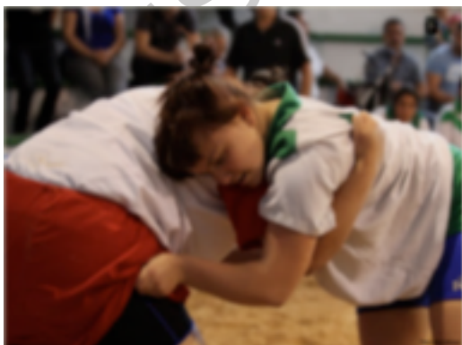
13. Lucha canaria femenina

La Federación de Lucha Canaria organiza para cada temporada un calendario de competiciones en las que participan los clubes y luchadores de todas las islas. Muchas de ellas se han convertido en un encuentro clásico, que los espectadores esperan con gran interés y que reseñamos a