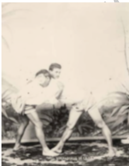
4. Luchadores de Canarias

En la década de los años cuarenta en el siglo XX es donde se sitúa la frontera entre la época folclórica y la institucional. Siendo en esta época cuando se comienza regular los encuentros de lucha y todas las circunstancias que le rodean.