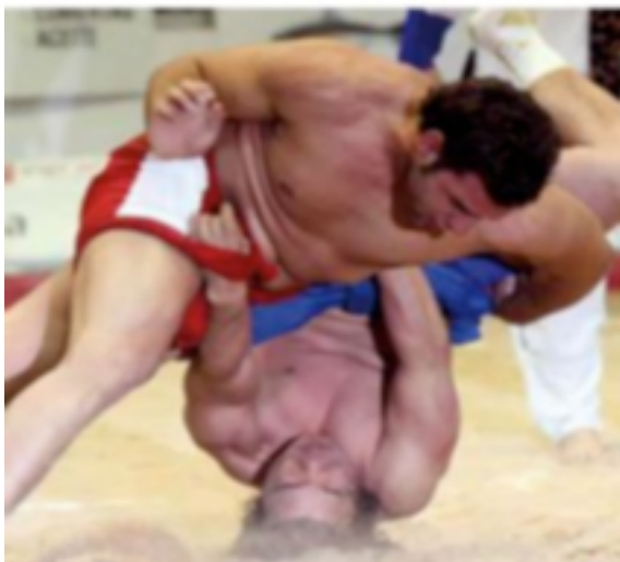
5. Luchada actual en Canarias

También en lo que se conocía por provincia española del Sahara