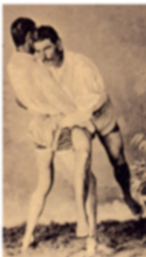
1. Antiguos luchadores

Todos los cronistas e historiadores de la época de la conquista de estas islas hacen referencia a la práctica de una modalidad de lucha por parte de la población autóctona del archipiélago. Pero todas estas crónicas hacen referencia más a una descripción del tipo de lucha que se realizaba que a averiguar el origen o procedencia de la misma.